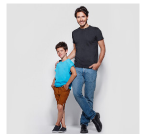
Camiseta Dogo Premium Roly